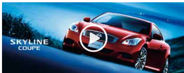
スタート動画広告

3D写真の前後に動画を設定することができ、企業やブランドのPRとしてご利用可能です。