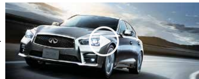
クロージング動画広告